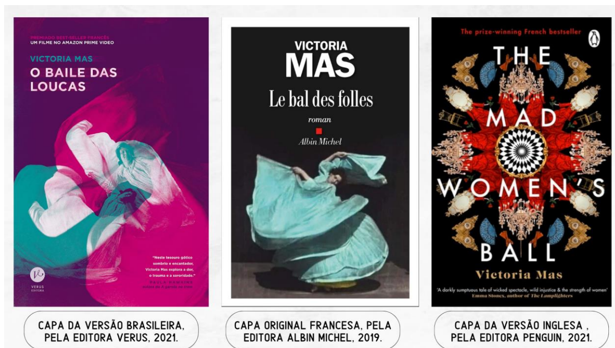
Figura 1— Capas do livro O baile das loucas.