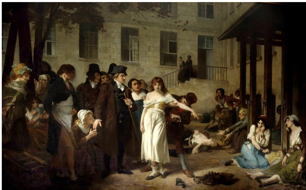
Fonte: Pintura de Tony Robert Fleury, século XIX.

A pintura representa a chegada de Pinel nas casas de internamento e ordenando a liberação dos alienados das correntes. Observa-se que Pinel é pintado de forma gloriosa, como um salvador e foi esse retrato que ficou salvo no imaginário, de um Pinel libertador dos loucos. O internamento, agora com nome de Asilo e mais à frente ganhará também outros nomes, tornou-se um espaço “tanto de verdade quanto espaço de coação” (Foucault, 1978, p. 476). No lugar de correntes, criaram-se as camisas de força, um “colete estreito de brim ou lona forte que amarra e prende os braços que deve incomodar tanto mais quanto mais violentos forem os movimentos feitos” (Foucault, 1978, p. 480). O asilo também se tornou o espaço onde os médicos tinham uma área ampla de trabalho, sendo agora não só um depósito de loucos, mas uma grande sala de espera de um consultório médico.