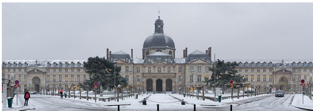
Figura 3 — The Pitié-Salpêtrière Hospital under the snow.