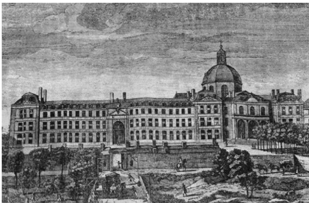
Figura 2 — La Salpêtrière in 1760.

Fonte: Gravura feita por Regaud. Imagem retirada da Revista Neurología, vol. 28, n. 1, 2013 — Espanha.