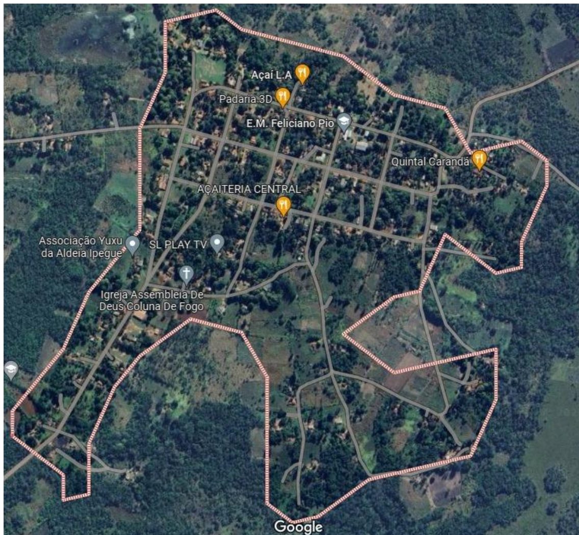
Imagem. 6 Limite territorial da Aldeia Ipegue

Para a demonstração da extensão territorial atual, abaixo está inserida a imagem do mapa da Aldeia Ipegue. Aos arredores desta aldeia estão localizadas as fazendas que desenvolvem a pecuária, mas que atualmente foram retomadas pelos indígenas das demais aldeias existentes nessa região. Ressaltando que as fazendas próximas da Aldeia Ipegue foram retomadas no ano de 2013 pelos indígenas da Aldeia Ipegue e das demais aldeias vizinhas e permanecem morando na retomada até os dias atuais, onde há a organização social, sendo coordenado por um cacique.