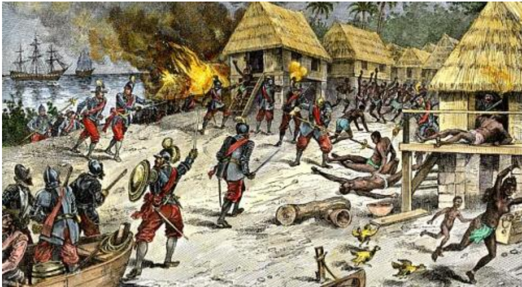
Imagem 02 - Confronto dos europeus contra os povos indígenas

O confronto devido as questões territoriais, prática de garimpo ilegal em terras indígenas e retirada de madeiras tem ceifado a vida de vários líderes indígenas espalhadas pelo Brasil, como ocorreu com os primeiros indígenas na época da invasão europeia ilustrada na imagem a seguir.