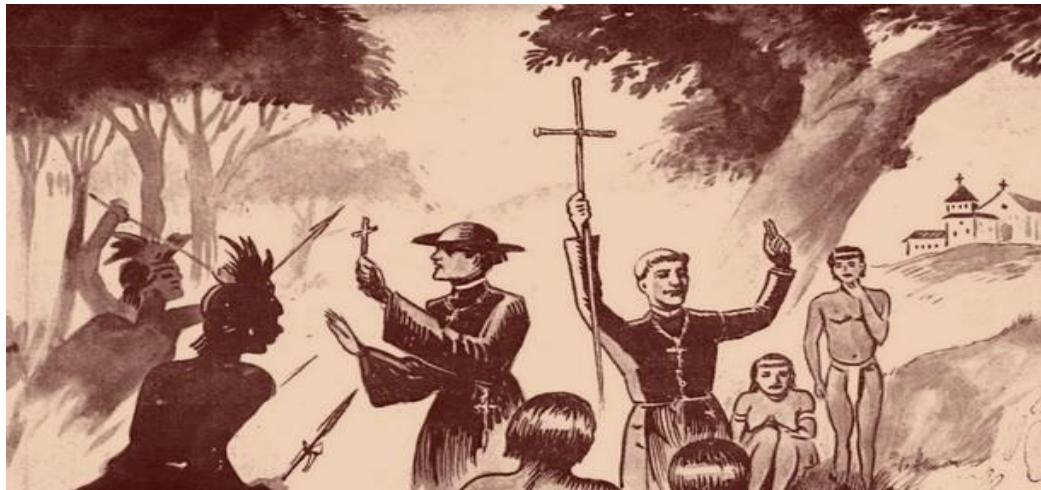
Imagem 3 - Ensino da Religião Cristã

Após a chegada dos europeus a catequese foi um dos ensinamentos religioso imposto aos povos originários que tinham e tinham como foco principal ensinar às crianças indígenas, pois de acordo com a concepção dos padres jesuítas acreditava-se que as crianças eram mais fáceis de serem dominadas e ensinadas. Abaixo está inserida a imagem que ilustra a catequização dos indígenas através do uso da cruz.