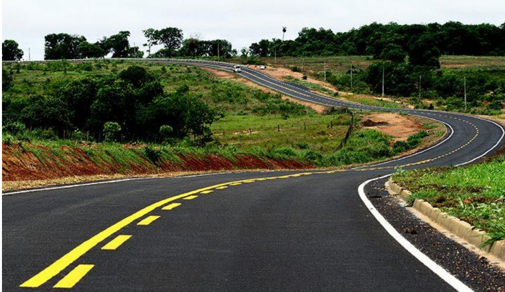
Imagem 7- Asfalto MS – 442, acesso ao Distrito de Taunay; Foto: Saul Schramm.

Fonte: https://www.acritica.net/editorias/geral/sonho-de-muitas-geracoes-asfalto-no-acesso-ao-distrito-de-taunay-em-aq/566973/