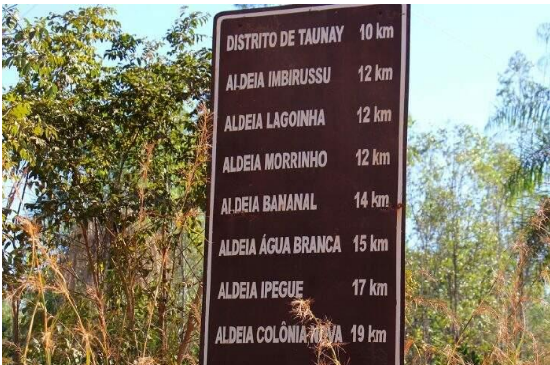
Figura. 08 Aldeias Terena da Terra Indígena (TI), Taunay/Ipegue.

Para chegar até a Aldeia Ipegue é necessário trafegar pela BR 262, entre os municípios de Aquidauana e Miranda. A BR 262, fica à uma distância de 17km da Aldeia Ipegue, onde há também demais aldeia como está inserida na imagem abaixo.