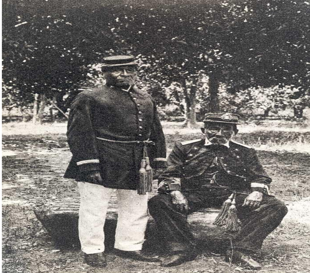
Imagem 4 – Indígenas Terena que lutaram na guerra do Paraguai.

Após a guerra, os indígenas sobreviventes foram considerados heróis quando chegavam em suas aldeias, sendo homenageadas e condecoradas pelos militares brasileiros sendo nomeados como capitão em suas comunidades indígenas. A partir desse período Pós-Guerra iniciou-se a nomenclatura capitão que perdurou por muito tempo entre os indígenas da etnia Terena.