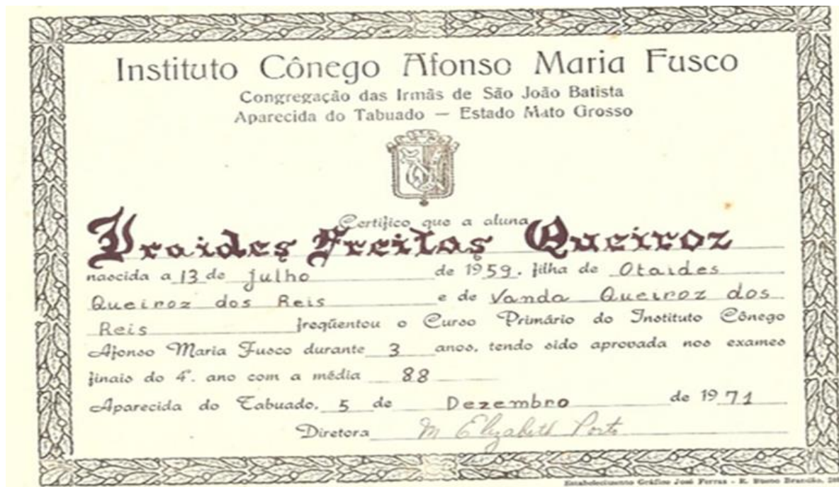
Figura 6. Certificado de Conclusão de Curso no ano de 1971.