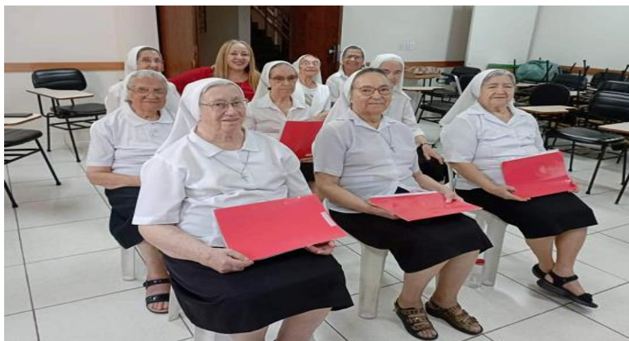
Figura 22. Preparação das irmãs Batistas para apresentação natalina na Casa Provincial em Belo Horizonte (MG)