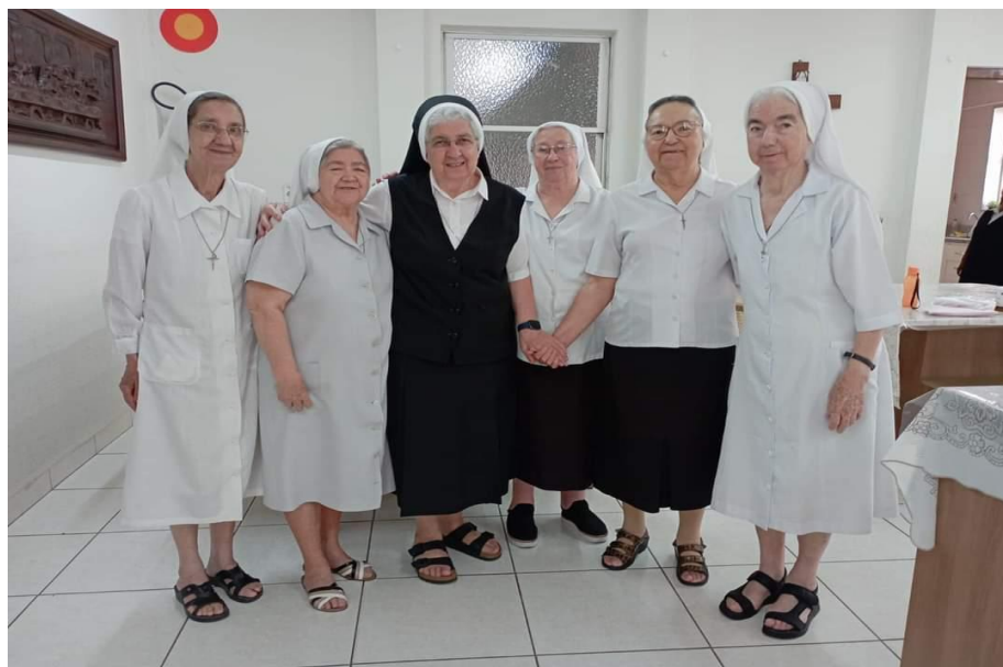
Figura 20. Irmãs Batistas na Casa Provincial em Belo Horizonte (MG).