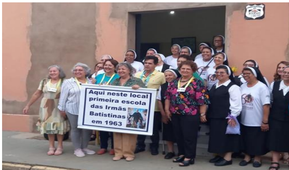
Figura 24. Irmãs Batistinas durante festividades de comemorações de 60 (sessenta) anos de chegada ao município de Aparecida do Taboado e fundação do Instituto Cônego Afonso Maria Fusco.

Nota: Registro fotográfico feito pela autora.