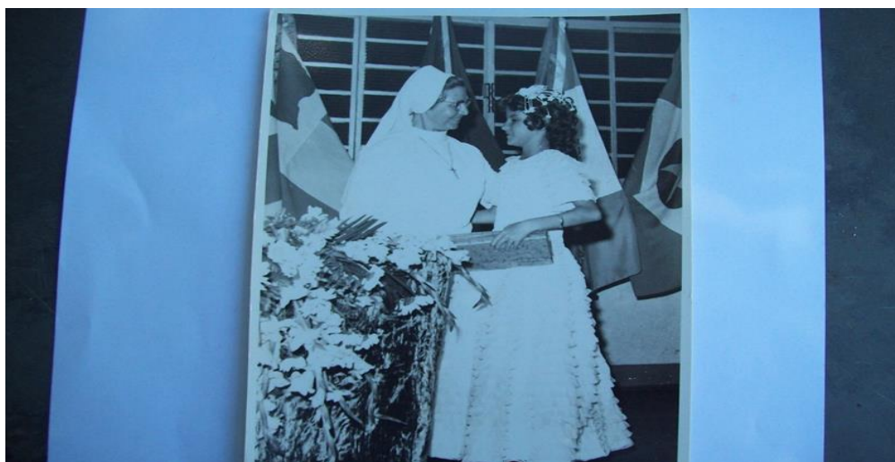
Figura 8. Cerimônia de formatura.