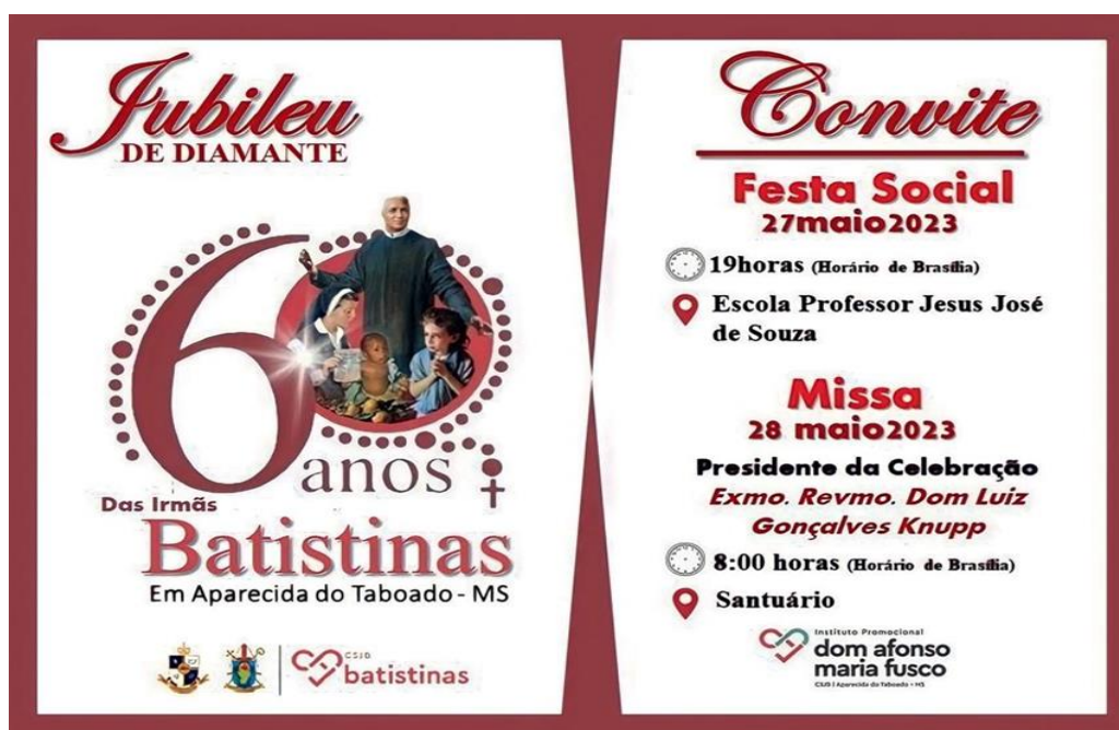
Figura 23 – Convite para participar da festa de comemoração dos 60 anos da chegada das Batistinas em Aparecida do Taboado (MS).