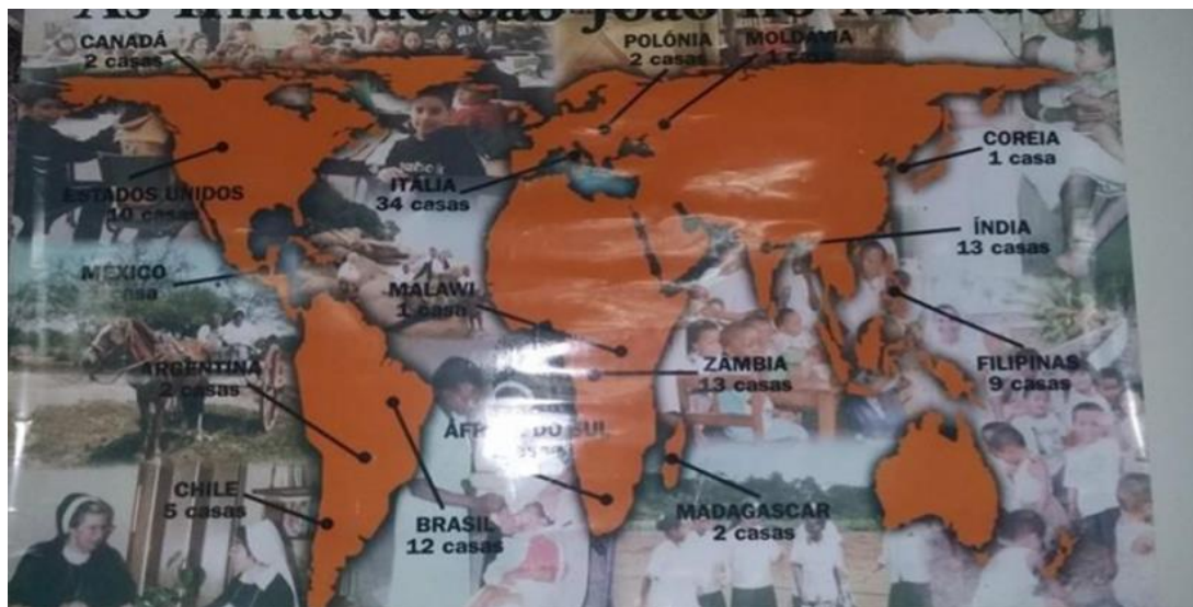
Figura 15. Irmãs Batistinas no mundo.

Fonte: https://www.batistinas.org.br/institucional/historia-da-congregacao . Acesso em: 09 set. 2023.