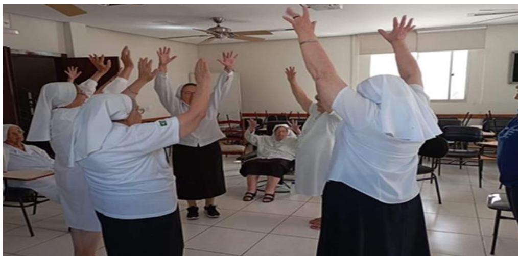
Figura 16. Irmãs Batistinas durante atividades físicas na Casa de Repouso em Belo Horizonte (MG).