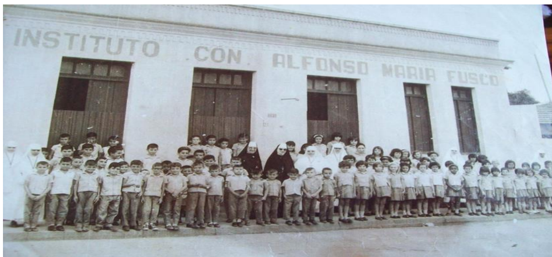
Figura 5. Irmãs Batistinas e estudantes na fachada do Instituto Cônego Afonso Maria Fusco.