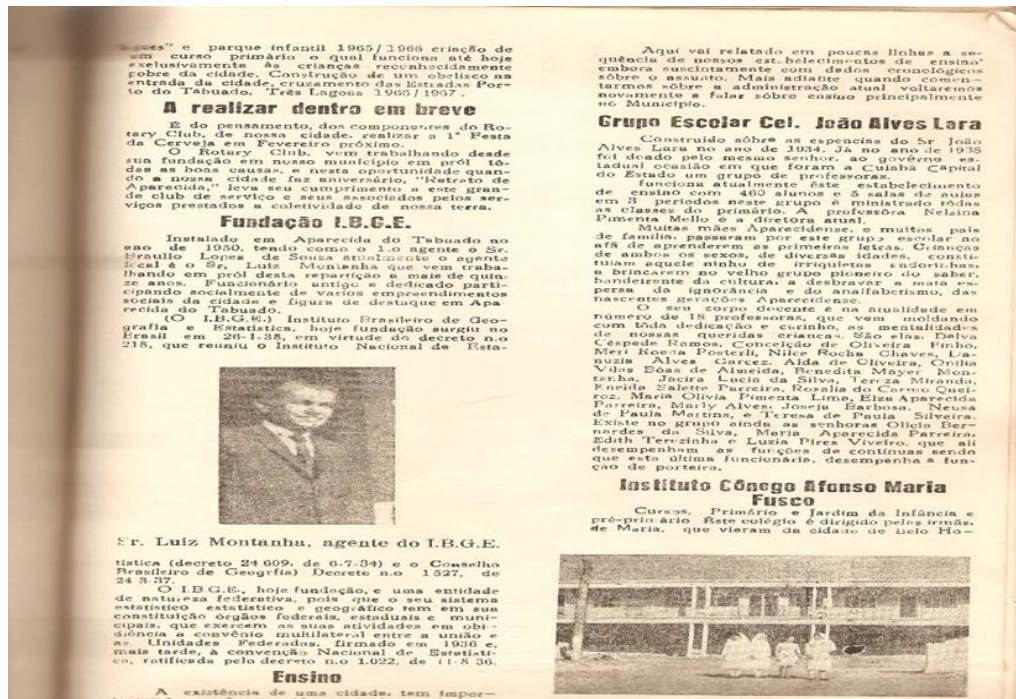
Figura 10. Jornal do vigésimo aniversário de emancipação de Aparecida do Taboado.