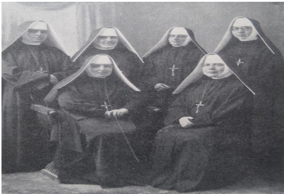
Figura 12. Batistinas que vieram para o Brasil no século XIX.