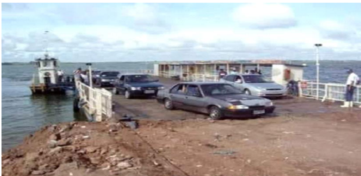
Figura 2. Chegada das irmãs Batistinas de Balsa no Município de Aparecida do Taboado (MS), em 1963.