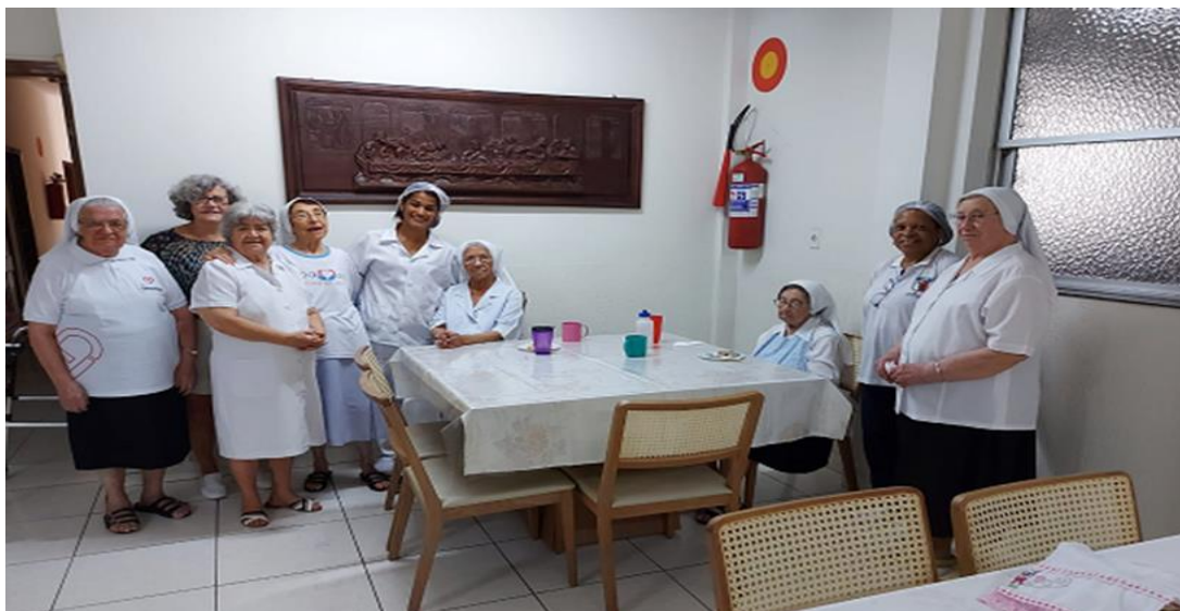
Figura 17. Irmãs Batistas na Casa de Repouso em Belo Horizonte (MG), reunidas durante o almoço.