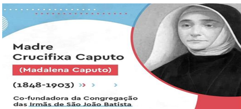
Figura 13. Imagem da Madre Crucifixa Caputo.

A fotografia histórica apresentada na Figura 13 retrata Madre Crucifixa Caputo, cujo nome de batismo era Madalena Caputo, que viveu entre 1848 e 1903. Ela foi uma pessoa religiosa importante, conhecida por ser cofundadora da Congregação das Irmãs de São João Batista, também denominada como Batistina (MEDEIROS, 2000, p. 21).