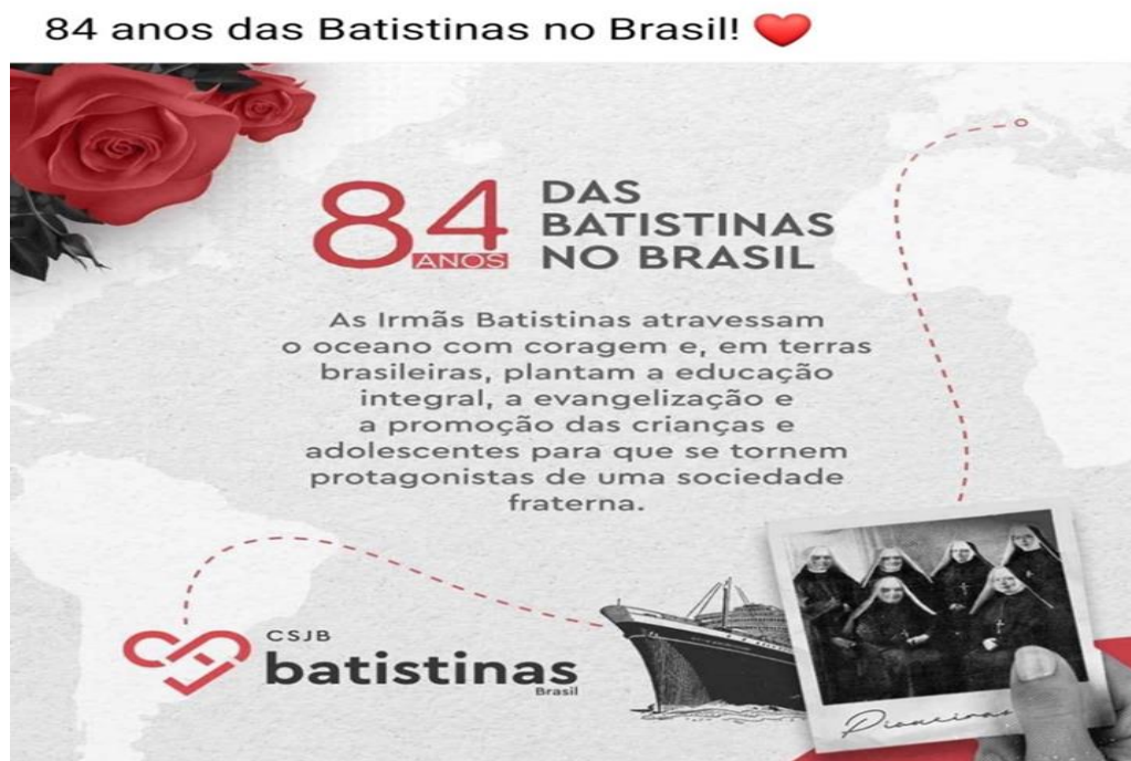
Figura 14. Comemoração dos 84 anos das irmãs Batistas no Brasil.