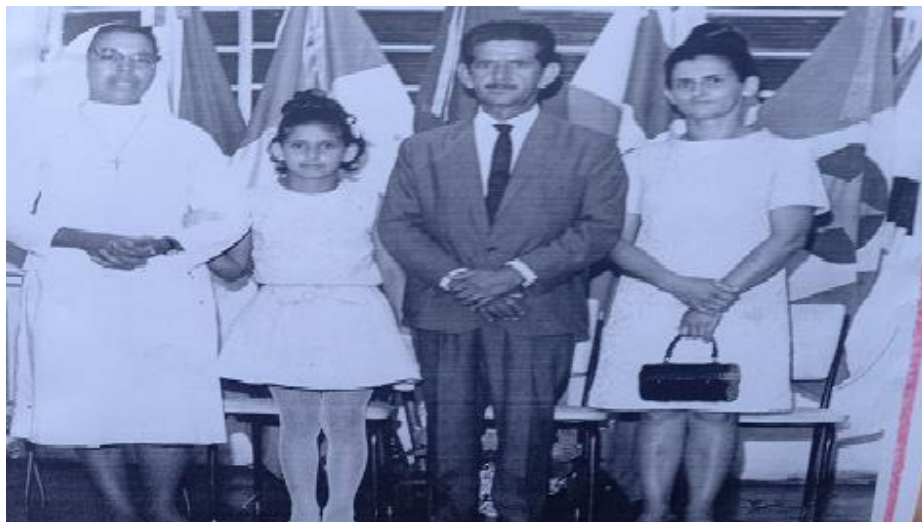
Figura 7. Cerimônia de formatura.