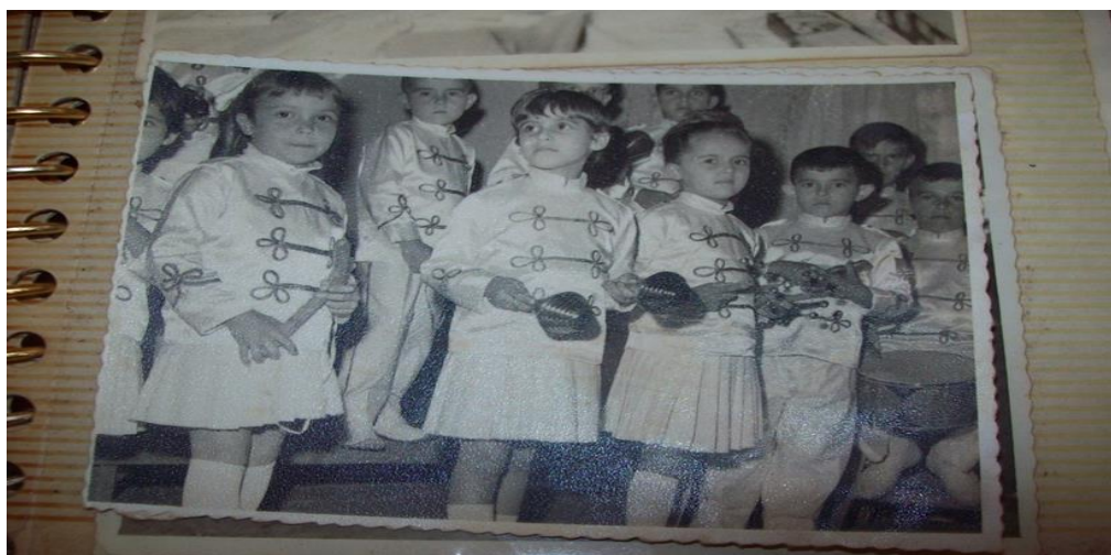
Figura 9. Crianças que participavam da banda escolar.