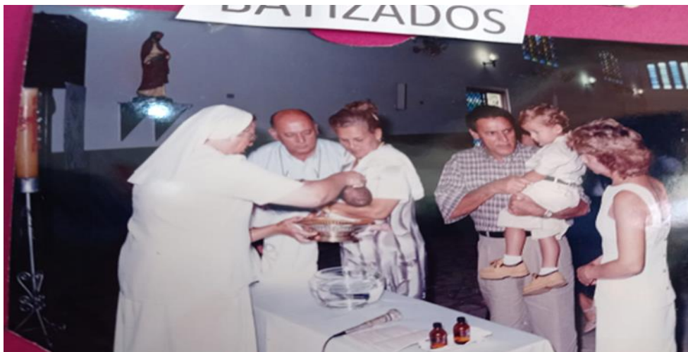
Figura 3. Mulheres Batistinas realizando batizado.