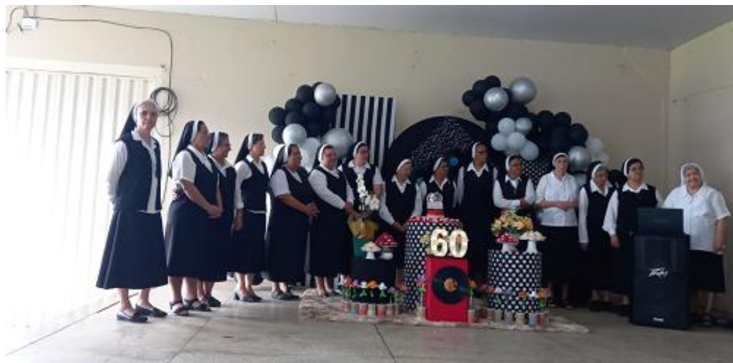
Figura 25. Comemoração dos 60 anos das irmãs Batistinas em Aparecida do Taboado (MS).