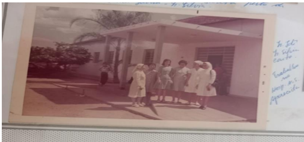
Figura 4. Irmãs Batistinas em frente a um hospital.