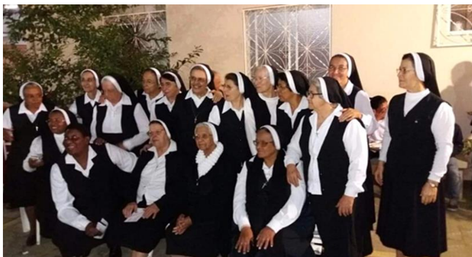
Figura 19. Irmãs Batistas durante recepção de irmã italiana.