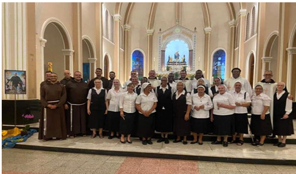
Figura 18. Convenção que reuniu várias Batistinas de diversas localidades.